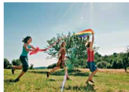
Kinderfüße sollen toben

Erkrankungen zu vermeiden. Allzu häufig lässt sich feststellen, dass Kinder selbst einfache Übungen wie Rückwärtslaufen oder Stehen auf einem Bein nicht mehr beherrschen. Der Berufsverband der Fachärzte für Orthopädie und Unfallchirurgie in Deutschland (BVOU) weist mit dem bundesweiten Aktionstag „Zeigt her eure Füße“ am 10. November 2010 an einer Reihe von Grundschulen auf die Problematik