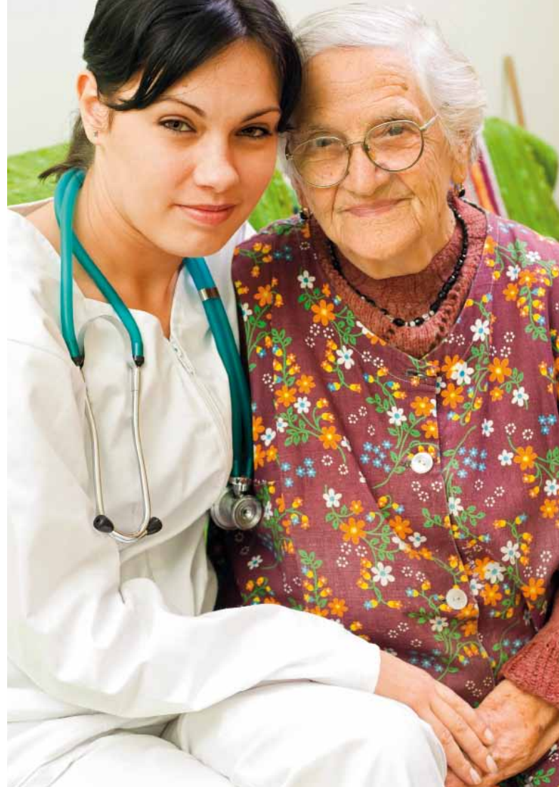
Interkulturelle Pflege selbstverständlich

Bereits jetzt gibt es spezielle Pflegedienste für bestimmte Migrationsgruppen. Mit jeweils rund 3 Millionen Personen sind die Russen und Türken in Deutschland die größten Gruppen ausländischer Herkunft. Hier haben sich bereits spezielle Pflegeeinrichtungen gebildet. So ist der Moabiter Pflegedienst Dosteli auf Menschen mit türkischen Wurzeln spezialisiert. Hier kommt mit dem Islam auch eine vom Christentum abweichende Religion dazu, ähnlich ist es aber auch mit dem Judentum. Je nach Herkunft und Glauben müssen einige spezifische