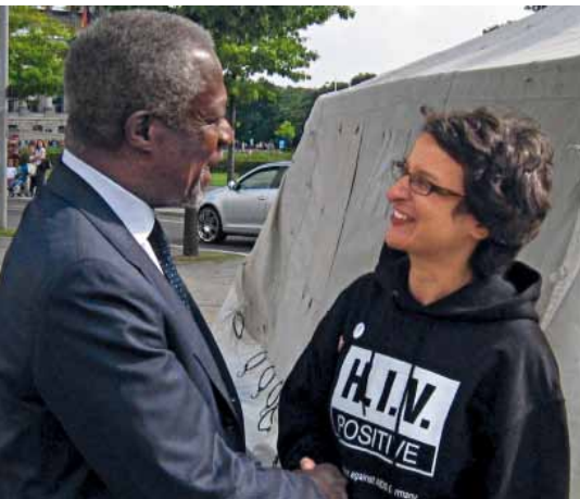
Kofi Annan bei Aktionsbündnis in Berlin

Der ehemalige UN-Generalsekretär Kofi Annan beim Besuch einer Protestaktion des Aktionsbündnis ge-