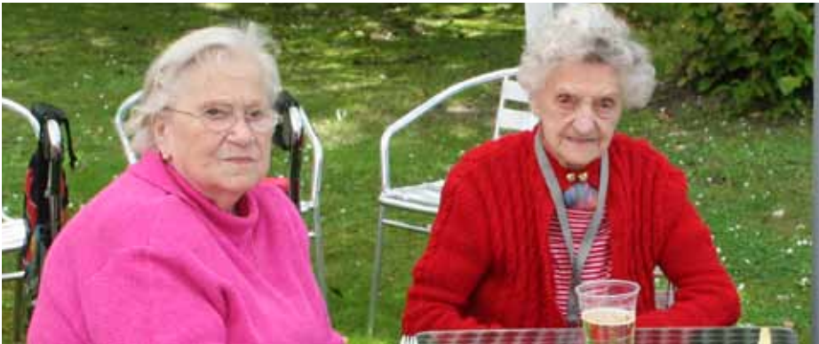
Auch eine Kaffeepause gehörte zum Ausflug.

pflge zu Hause. Es gab den Wunsch bei einigen nochmal diese Attraktion ihrer Heimat zu sehen. Ein schöner Tag, freuten sich die Reisenden und eine fügte an, das letzte Mal war ich vor 20 Jahren hier gewesen, damals noch mit meinem Mann.