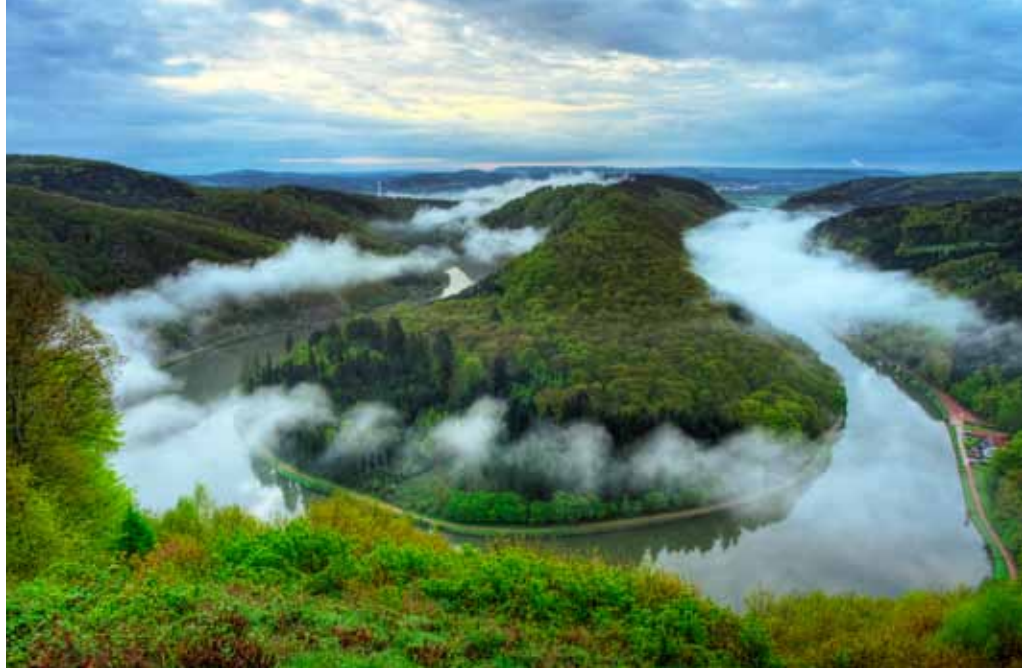
Blick auf die Saarschleife

Die Aussicht von Cloef zieht auch immer wieder prominente Besucher an. Unter ihnen waren bereits viele Staatsoberhäupter, die immer wieder dafür gesorgt ha-