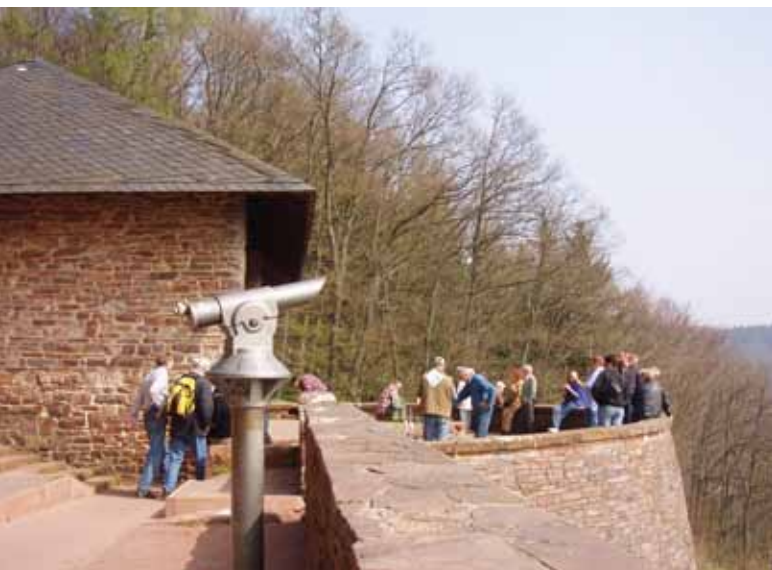
Aussichtspunkt Cloef

Der Nebel hängt auch um 9:00 Uhr noch tief im Tal. Von der Aussichtsplattform hat man einen wunderbaren Blick. Die bewaldeten Hänge scheinen in einem Band aus Nebel zu verschwinden, das sich durch das Tal zieht. Unten fließt die Saar einen großen Bogen. Hier befindet sich ein wunderschönes Natur- oder Landschaftsschutzgebiet.