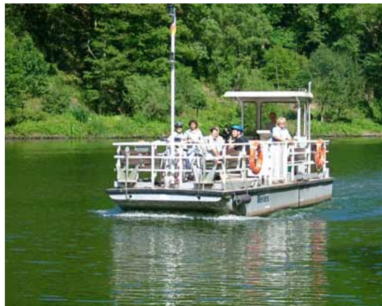
links: Blick über die Saar auf Dreisbach / rechts: Saar-Fähre Wellness: