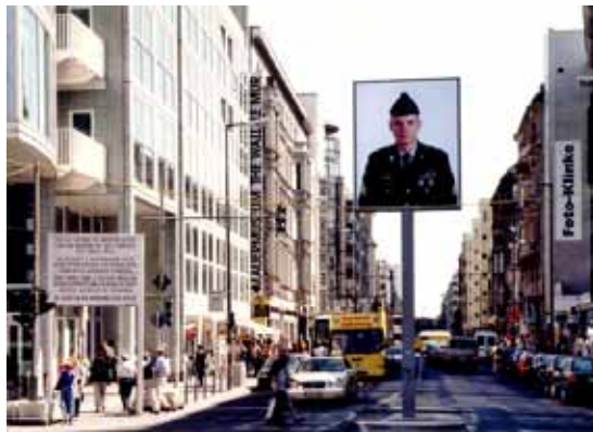
Touristenziel Checkpoint Charlie

In Berlin öffneten sich U-Bahnhöfe, die Jahrzehnte zugemauert waren.