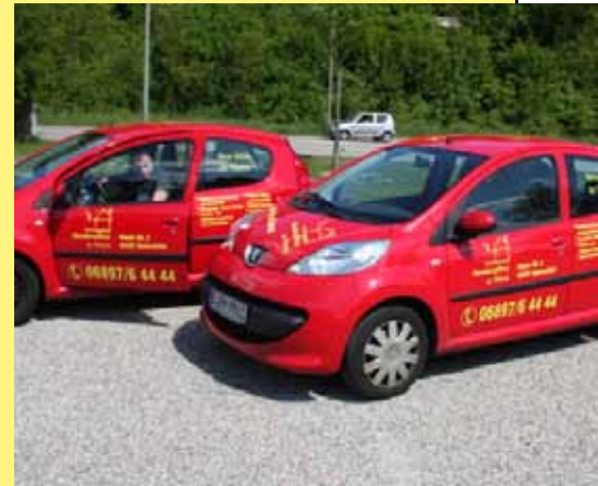
Mobile Sozialstation

Deutliches Zeichen der Sozialstation Krankenpflege zu Hause in Quierschied, Saarbrücken und den weiteren Gemeinden des Saarlands, in denen unsere Mitarbeiter unterwegs sind, sind die roten Autos.