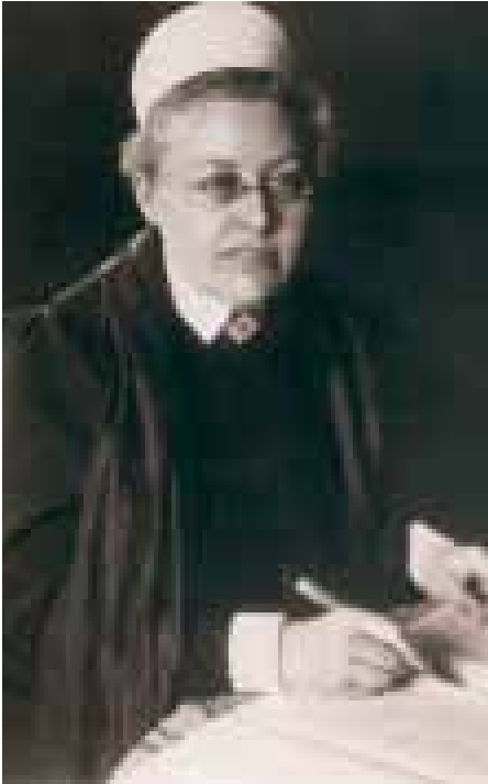
Agnes Karll

Die Krankenpflege in Deutschland ist eng mit dem Namen Agnes Karll verbunden. Wer aber war die Frau, nach der einige Kliniken, eine Reihe von Altenheimen und das Institut für Pflegeforschung in Berlin (AKI) benannt sind?