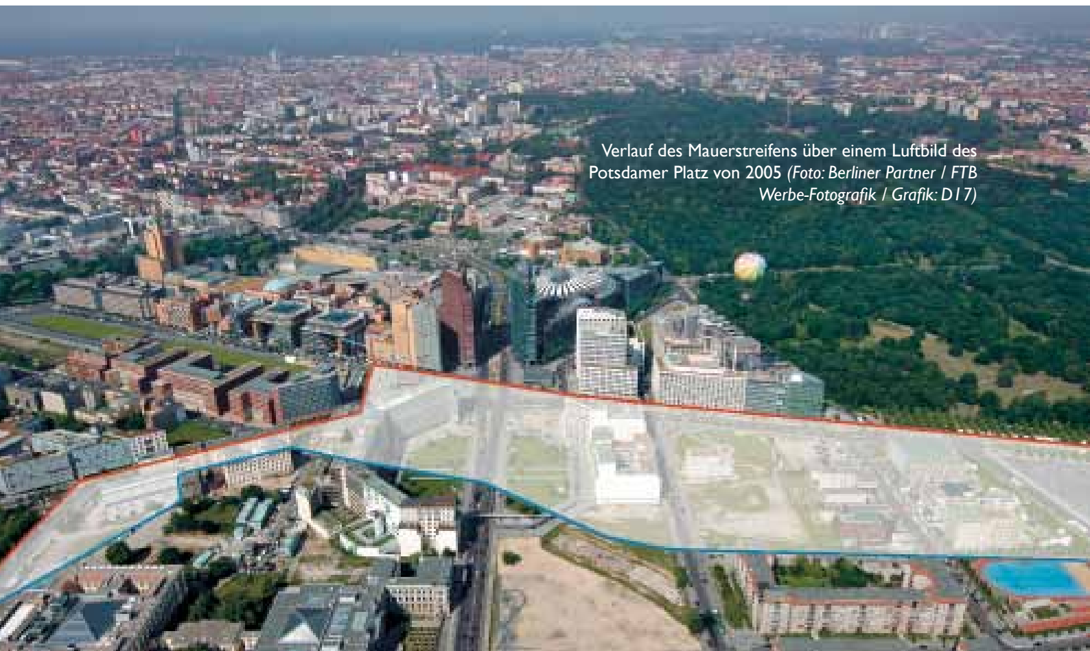
Verlauf des Mauerstreifens über einem Luftbild des Potsdamer Platz von 2005 (Grafik: D17)

In der Folgezeit wurden immer mehr Übergänge zwi-