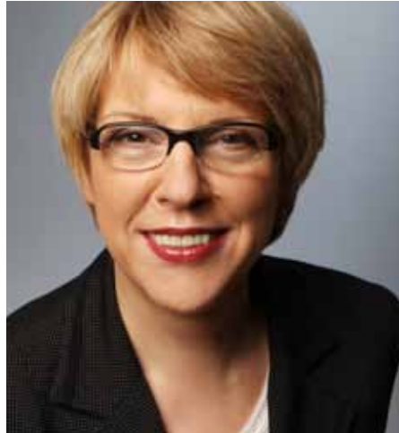
Elisabeth Beikirch bekämpft jetzt die Pflege-Bürokratie

Seit dem 1. Juli soll im Bundesministerium für Gesundheit (BMG) mit Hilfe einer neu eingerichteten Arbeitsstelle die ausufernde Bürokratie in der Pflege eingedämmt werden. Als „Ombudsfrau für Entbürokratisierung in der Pflege“ – so die offizielle Stellenbezeichnung – konnte die unabhängige Pflegeexpertin Elisabeth Beikirch verpflichtet werden. In dieser Funktion wird die Berlinerin die geplante Pflegereform begleiten und ihrerseits Vorschläge für weniger Bürokratie in der Pflege unterbreiten.