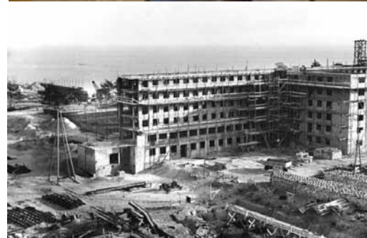
Prora von der Meeresseite (oben, Foto: Steffen Löwe), nachgebauter KdF-Raum (mitte, Foto: Schramme), in der Bauphase (unten, Foto: Bundesarchiv)