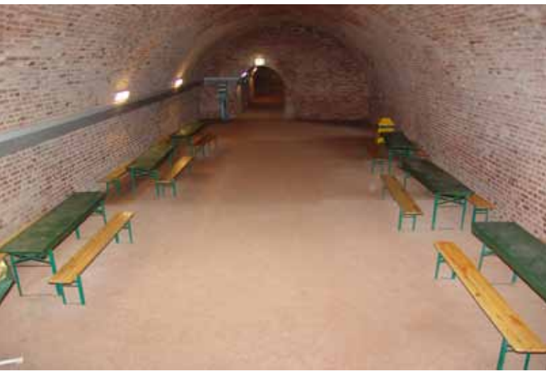
Kaverne der Bunkeranlage

Sie sind die größten Buntsandsteinhöhlen Europas, die Schlossberghöhlen in Homburg. Entstanden ist die Anlage durch die Schaffung von unterirdischen Räumen für die Burg Hohenburg und durch den Abbau von Buntsandstein in der Zeit vom 11. bis zum 17. Jahrhundert. Insgesamt bestehen die Höhlen aus zwölf Stockwerken mit einer Gesamtlänge von über fünf Kilometern.