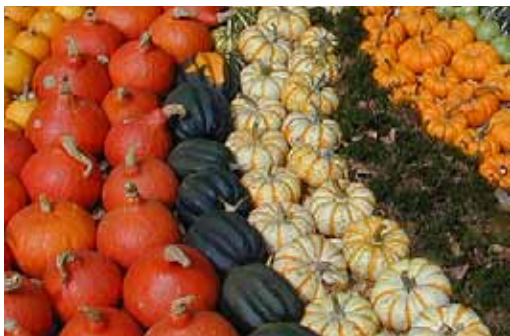
Kürbisausstellung in Zürich 2003

Herbstzeit ist Kürbiszeit, auch in Deutschland, wo längst auch das amerikanische Halloween-Fest angekommen ist. Am 31. Oktober werden wieder Kinder als Monster