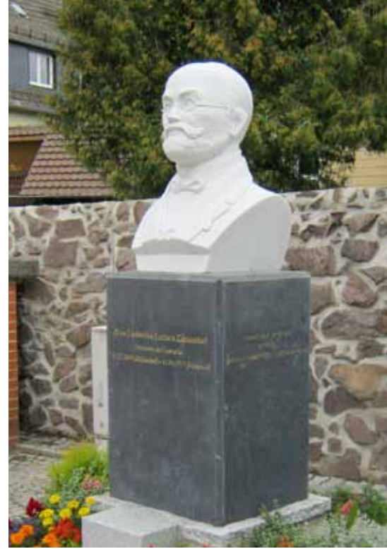
Zamenhof-Denkmal in Herzberg

ten dauerhaften Landesverbände in Afrika, in den 1970er Jahren kam es zu einem Aufschwung der Esperanto-Verbände in Lateinamerika. Und 1980 durfte endlich auch der chinesische Landesverband dem Esperanto-Weltbund beitreten.