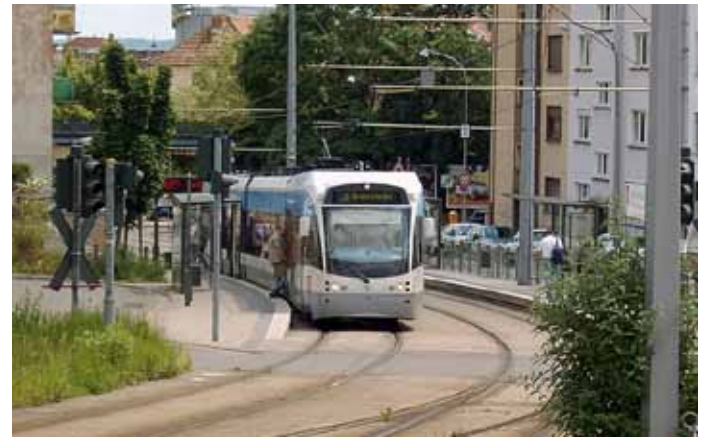
Links: Saarbahn vor der Johanniskirche - Rechts: Haltestelle Ludwigstrasse

Kernstück der Saarbahn ist eine Streckenführung als Straßenbahn durch die Innenstadt von Saarbrücken, die zumeist dem Verlauf der ehemaligen Straßenbahnlinie 5 folgt, die bereits 1965 als letzte Linie stillgelegt wurde. Die Planungen der Strecke fingen bereits 1990 an. Der Busverkehr hatte in der Innenstadt von Saarbrücken derart stark zugenommen, dass die Busse teilweise im 60 Sekunden Abstand gefahren sind.