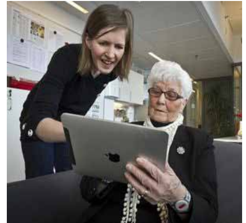
Zukunft: Erinnerungen aus dem Netz

Dieser simple, ungezwungene Kontakt hat auch das allgemeine Sicherheitsgefühl gesteigert. Dies nicht zuletzt, weil das Personal weniger Zeit dafür aufwenden muss, Verwandte zu verständigen. Die positiven Ergebnisse der Wissenschaftler sind auch Grundlage für die Fortsetzung der Versuche mit digitalen Benutzeroberflächen: "Es gibt ein großes Potenzial im Pflegebereich", so ein SINTEF-Wissenschaftler. Derzeit wird ein Prototyp in Drammen in Südnorwegen getestet. | pte