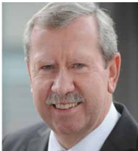
Gesundheitsminister Weisweiler

Einer der großen Punkte ist die neu geschaffene Möglichkeit der sektorenübergreifenden Bedarfsplanung. „Die Länder erhalten flexible Möglichkeiten, entsprechend den regionalen Gegebenheiten und Erfordernissen in größerer Eigenverantwortung die gesundheitliche Versorgung zu steuern – ausgerichtet am jeweiligen Bedarf der Menschen vor Ort“, so Minister Weisweiler. Beispielsweise erhalten die Länder ein Mitsprache- und Initiativrecht im gemeinsamen Bundesausschuss. Zwei Länder werden künftig an den Beratungen des gemeinsamen Bundesausschusses in Fragen der Bedarfsplanung teilnehmen. Dies ist auch das Vorsitzland der GMK – also im nächsten Jahr das Saarland. Schließlich wird es ein neues Gremium geben, das aus Vertretern des Landes, der kassenärztlichen Vereinigung, der Landesverbände der Krankenkassen sowie der Er-