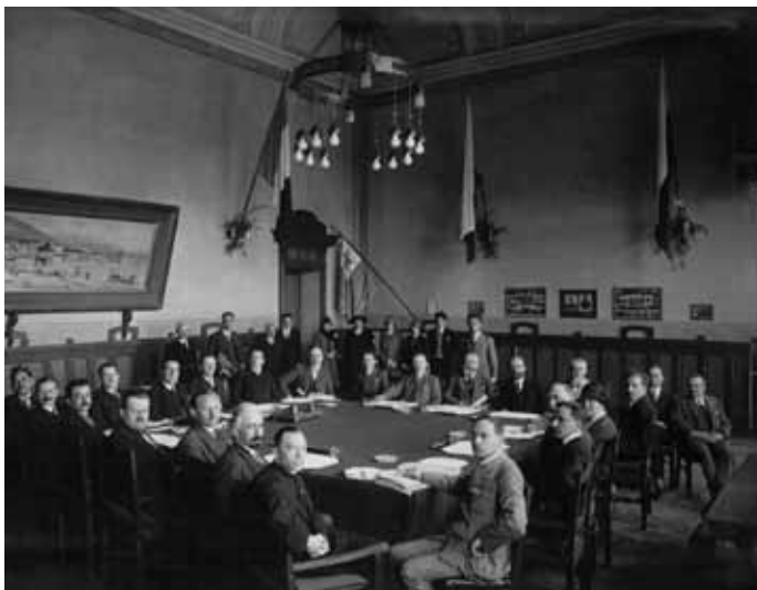
Sitzung der Esperanto-Bewegung, im April 1926 in Locarno

Obwohl die Zeit zwischen den beiden Weltkriegen durch Wirtschaftskrisen und Inflation geprägt war, wuchs die Sprachgemeinschaft weiter. In mehr als einem Dutzend Ländern kam es aber zu politischen Behinderungen der Bewegung. Im nationalsozialistischen Deutschland wurde die Betätigung verboten und die Verbände aufgelöst. Unter Josef Stalins Herrschaft in der Sowjetunion war die Bewegung zwar nicht ausdrücklich verboten, doch starben vermutlich einige tausend Esperantisten, die wegen „staatsfeindlicher Aktivitäten“ hingerichtet wurden.