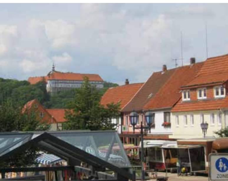
Blick auf die Esperanto-Stadt Herzberg

Gemeinde über die gut ausgebauten Bundesstraßen unterbricht und einen Stopp einlegt, stößt auf eine Reihe von Schildern mit dem Vermerk „Esperanto-Urbo“. Seit dem 12. Juli 2006 ist Herzberg offiziell eine Esperanto-Stadt.